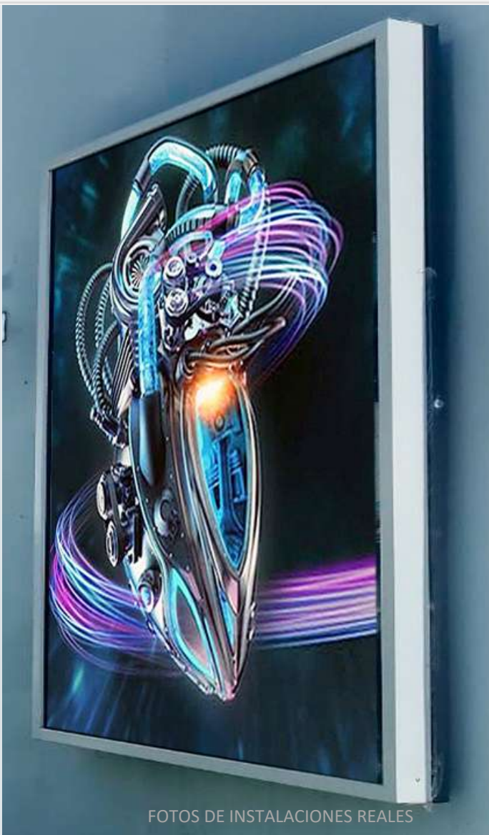
FOTOS DE INSTALACIONES REALES